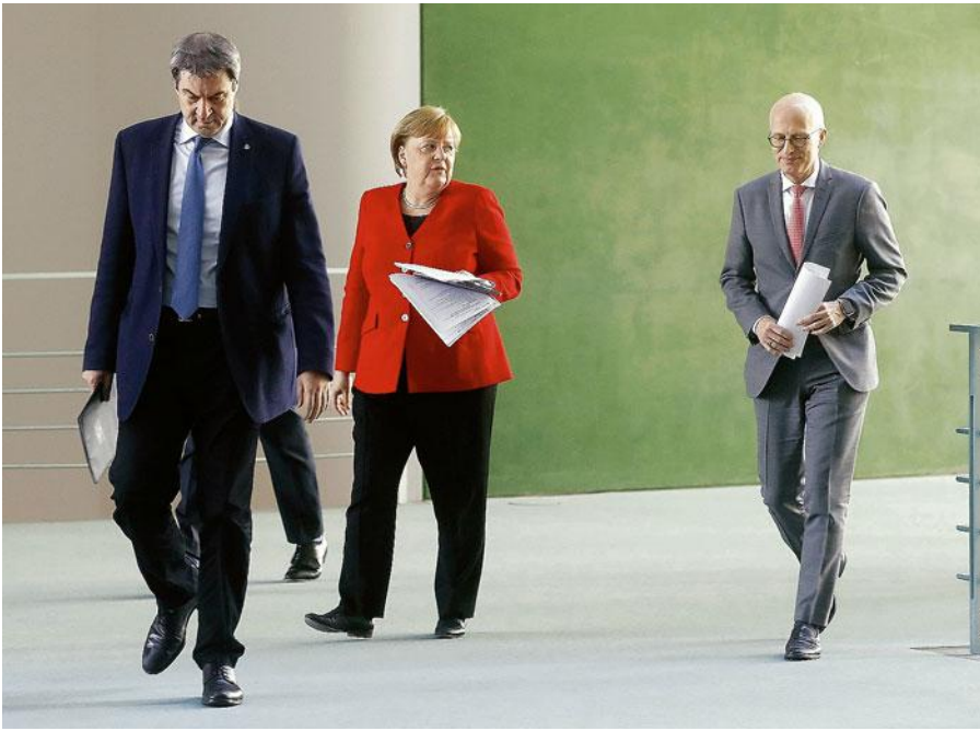
Kanzlerin Merkel, Länderchefs Söder, Tschentscher*: Angst vor der Wut

platz zur »Mahnwache für das Grundgesetz« versammelt, aufgerufen hat die Bewegung »Querdenken 711«. Es stehen nicht nur chronische Merkel-Hasser oder Impfgegner hier, sondern auch Menschen, die während der Krise ihren Job verloren haben. Alleinerziehende Mütter sind gekommen oder Gastronomen, die ihr Restaurant schließen mussten. Sie halten die Einschränkungen für unverhältnismäßig, protestieren »gegen staatliche Willkür«, für die »Wiederherstellung der Grundrechte« oder die Rettung des Stuttgarter Nachtlebens.