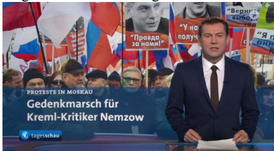
Abb. 13: Tagesschau, 26.02.2017, 20 Uhr

Neben Akteuren, dessen Stimmen im O-Ton zu hören sind, spielen auch Hintergrundtöne aufgrund ihrer Wirkung auf die Zuschauer eine beachtliche Rolle: Die Demonstranten