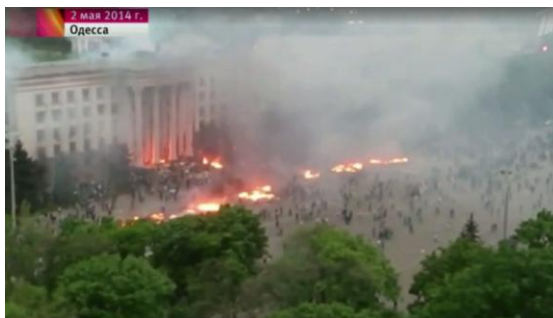
Abb. 24: Wremja, 02.05.2017, 21 Uhr, 03:46

Gemeinsamkeiten: Beide Seiten möchten den Dialog zwischen der syrischen Regierung und der Opposition sowie den gemeinsamen Kampf gegen den radikalen Islamismus unter der Schirmherrschaft der Vereinten Nationen unterstützen. „Trotz aller Meinungsunterschiede, sprechen Russland und Deutschland weiterhin dieselbe Sprache“ (W, 02.05.2017) – im Wremja -Beitrag ist das nicht bloß ein metaphorischer Ausdruck. Denn Merkel begrüße Putin auf Russisch, im Hintergrund ist „Zdravstvuyte“ („Hallo“ auf Russisch) zu hören, und Putin verabschiedete sich von der Bundeskanzlerin auf Deutsch.