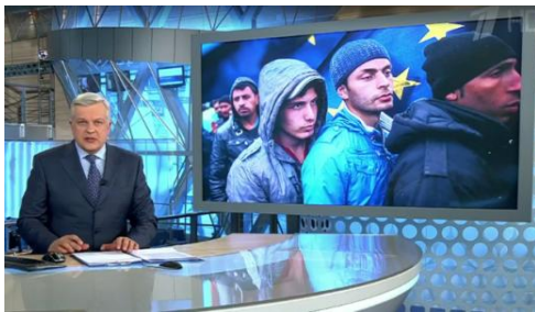
Abb. 22: Wremja, 31.01.2017, 21 Uhr

Flüchtlinge in Deutschland begangen haben. Diese sollen die Machtlosigkeit der Regierung bei der Krisenbewältigung beweisen und die Politiker, die eine fehlerhafte Politik führen, der deutschen Bevölkerung gegenüberstellen, die darunter leidet. So wird über eine Vergewaltigung und Tod einer Freiburger Studentin durch einen Flüchtling aus Afghanistan berichtet. In der Berichterstattung spielen symbolische Details eine beachtliche Rolle: Diese „Tragödie“ sei in ihrer psychologischen Wirkung mit den Ereignissen der Kölner Silvesternacht vergleichbar; das Opfer sei eine Tochter eines hohen EU-Beamten, die selber den Flüchtlingen geholfen hatte; der Täter sei im „Schicksalsjahr 2015“ nach Deutschland gekommen (W, 06.12.2017). Auch die deutschen Medien geraten in die Kritik: Die Tagesschau würde die Straftaten der Flüchtlinge vor der Wahlkampfrede Merkels absichtlich verschweigen und müsse jetzt auf „empörte Briefe der Zuschauer“ (ebd.) reagieren und sich rechtfertigen.