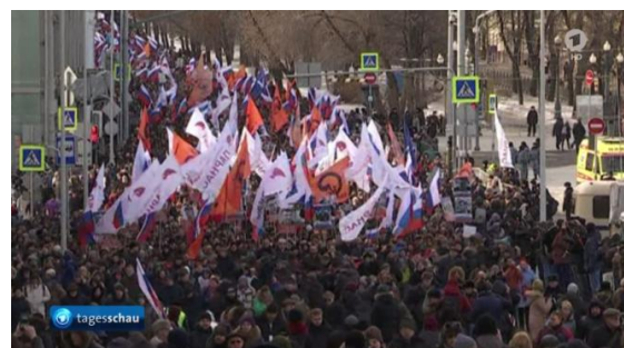
Abb. 14: Tagesschau, 26.02.2017, 20 Uhr, 00:48

Die Demonstranten werden in unterschiedlichen Einstellungen (von einem nahen Close-up bis hin zur Totalen) und aus verschiedenen Perspektiven (Normalsicht und Aufsicht) aufgenommen. In diesem Fall schafft die Aufsicht weder Überlegenheit noch Distanz, sondern macht die Zuschauer mit der Umgebung vertraut und zeigt die im Beitrag angesprochene Größenordnung der Proteste: „Tausende Menschen“, „großes Publikum“ (T, 26.02.2017) (Abb. 14). Die Symbole der russischen Opposition sind nicht zu