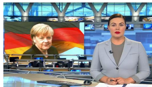
Abb. 21: Wremja, 06.02.2017, 21 Uhr

Zu Beginn des Untersuchungszeitraums, im Dezember, noch vor dem Berliner Terroranschlag, wurde in Wremja-Beiträgen ein tendenziell positives Bild der Bundeskanzlerin konstruiert. Grund dafür: eine neue Ausrichtung ihrer Flüchtlingspolitik, eine „180-Grad-Drehung“ (W, 06.12.2017), die Verschärfung des Asylrechts.