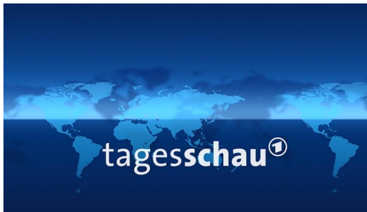
Abb. 1: Tagesschau-Titelbild

zufolge, mit der größten publizistischen Reichweite, dem Marktanteil von 34,6 Prozent und 9,8 Millionen Zuschauern täglich die meistgesehene Nachrichtensendung (Gscheidle & Geese, 2017, S. 315) und „der unbestrittene Sieger im Wettstreit um die Aufmerksamkeit des Publikums“ (Schäfer, 2007, S. 12). Häufig wird die Tagesschau gar „als Synonym für Fernsehnachrichten verwendet“ (Gscheidle & Geese, 2017, S. 314). Die fünfzehnminütige Hauptausgabe, die in der vorliegenden Arbeit in Betracht gezogen wird, wird nicht nur im Ersten – dem Gemeinschaftsprogramm der ARD – ausgestrahlt, sondern zusätzlich in den Dritten Fernsehprogrammen (außer MDR), bei 3sat, Phoenix, tagesschau24, ARD-alpha und One. Ihre Redaktion und Produktion sind beim Norddeutschen Rundfunk (NDR) angesiedelt. Der NDR-Staatsvertrag verpflichtet die Tagesschau , „einen objektiven und umfassenden Überblick über das internationale, europäische, nationale und länderbezogene Geschehen in allen wesentlichen Lebensbereichen zu geben“ (§ 5 Abs. 1 NDR-StV).