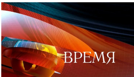
Abb. 2: Wremja -Titelbild

„ Wremja “ heißt auf Russisch „Zeit“ – Zeit für die wichtigsten Nachrichten des Tages. Wremja ist eine seit 1968 ausgestrahlte, halbstündige Hauptnachrichtensendung im Perwy Kanal (Erster Kanal), dem populärsten Fernsehsender Russlands. Zu Sowjetzeiten, aber auch nach dem Zerfall der Sowjetunion befand sich das Programm vom Perwy Kanal unter direkter oder indirekter Kontrolle des Staates. Heute besitzt der Staat 51 Prozent der Aktien, während der Rest im privaten Besitz von kremlnahen Banken und Großunternehmen ist.