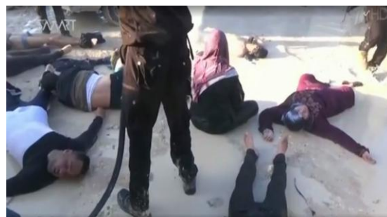
Abb. 25: Wremja, 02.05.2017, 21 Uhr, 04:08