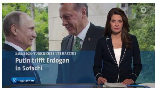
Abb. 7: Tagesschau, 03.05.2017, 20 Uhr

Russland und die Türkei werden grundsätzlich als Partnerländer dargestellt, dessen Verhältnis sich nach der „Eiszeit“ (T, 19.12.2016) wieder verbessert habe. Russland und die Türkei gehören zur Outgroup, denn sie „haben sich längst vom Westen abgewandt“ (T, 29.12.2016) und