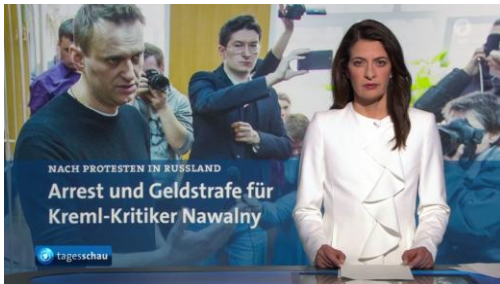
Abb. 12: Tagesschau, 27.03.2017, 20 Uhr