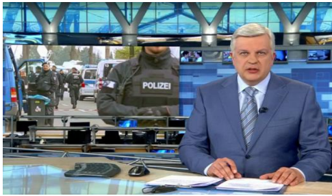
Abb. 18: Wremja, 12.04.2017, 21 Uhr

„Es gab eine große Gefahr, wir haben immer darauf hingewiesen, dass ein Terroranschlag jederzeit passieren kann. Deutschland, Westen stehen im Fokus von Terroristen“, sagte der Bundesminister des Innern Thomas de Maizière. Der Sicherheitsdiskurs ist durch den Terroranschlag auf den Berliner Weihnachtsmarkt maßgeblich geprägt. Außerdem wurde über die Festnahme von zehn von Terroristen angeworbenen Jugendlichen in Belgien berichtet, die Terroranschläge in Deutschland zum Weihnachtsfest geplant haben sollen (W, 17.12.2016), sowie über den vereitelten Terroranschlag auf das Einkaufszentrum in Essen, den die Terrormiliz IS vorbereitet haben soll (W, 11.03.2017). Dazu kam noch der Anschlag auf den Mannschaftsbus von Borussia Dortmund: Am 11. April 2017 detonierten drei Sprengsätze, in der Nähe des Anschlagortes wurden drei scheinbar islamistische Bekennerschreiben gefunden, die Polizei hat einen Iraker und einen Deutschen wegen ihrer mutmaßlichen IS-Verbindung vorläufig festgenommen (W, 12.04.2017). Zu einem späteren Zeitpunkt berichtete Wremja darüber, dass sich der angedeutete islamistische Hintergrund als falsch herausstellte und es sich beim Tatverdächtigen um einen Deutschrussen handelt (W, 21.04.2017).