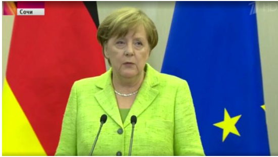
Abb. 23: Wremja, 02.05.2017, 21 Uhr, 02:23

Die Handlung spielt sich hauptsächlich in Sotschi in „Botscharow Rutschej“, der Sommerresidenz des russischen Präsidenten, ab. Die Videoaufnahmen aus Odessa (Ukraine) und Chan Schaichun (Syrien) werden ebenfalls eingebaut und werfen die Zuschauer mitten hinein in das Kriegsgebiet.