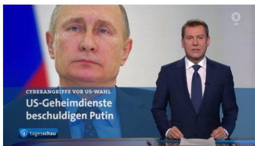
Abb. 11: Tagesschau, 07.01.2017, 20 Uhr