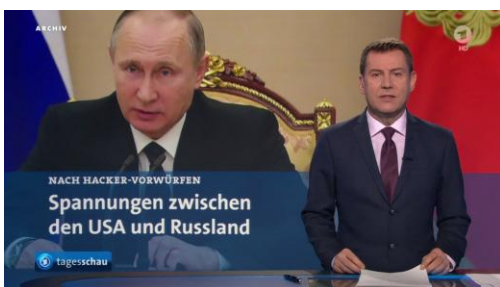
Abb. 10: Tagesschau, 30.12.2016, 20 Uhr

Der Personalisierungsdiskurs ist immer mit dem militärischen, diplomatischen, innenpolitischen bzw. wirtschaftlichen Diskurs verschränkt und bezieht sich vor allem auf die Person Wladimir Putins. In einigen Fällen ist die Trennlinie zwischen der Politikdarstellung und der