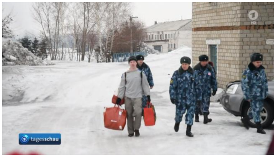
Abb. 15: Tagesschau, 26.02.2017, 20 Uhr, 01:51