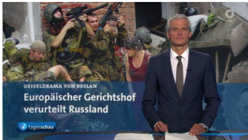
Abb. 8: Tagesschau, 13.04.2017, 20 Uhr

Kämpfer für ein unabhängiges Tschetschenien. Der Kreml ließ die Schule stürmen, mit Panzern, Kanonen und Flammenwerfern. Im Chaos der Explosionen versuchten Väter ihre Kinder selbst zu retten. Augenzeugen berichteten, Militär und Sondereinheiten seien überfordert gewesen und hätten so noch mehr Tote verursacht. Auf den alljährlichen Trauerfeiern habe der Staat die Angehörigen eingeschüchtert, so die Kläger. Kein einziger Militär oder Beamte wurde bislang zur Verantwortung gezogen“ (T, 13.04.2017).