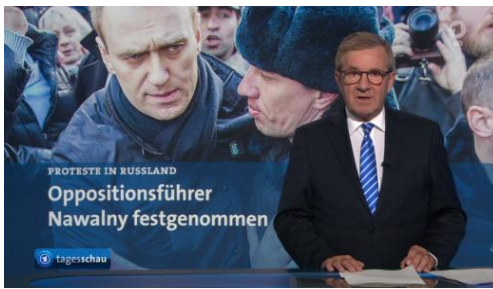
Abb. 9: Tagesschau, 26.03.2017, 20 Uhr

Ministerpräsidenten Dmitri Medwedew vorwirft, sich bereichert und mithilfe von Strohmännern „ein großes Immobilienreich“ (ebd.) geschaffen zu haben. Die Demonstranten forderten Medwedews Rücktritt, skandierten: „Putin, hau ab! Medwedew, hau ab!“ – und riefen: „Wir wollen nicht weiter zusehen, wie sie uns unser