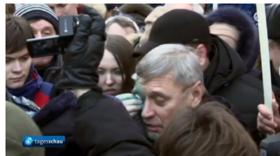
Abb. 16: Tagesschau, 26.02.2017, 20 Uhr, 01:36

Die Argumentationsstrategie in diesem Beitrag unterscheidet sich nicht von den Strategien, die im Laufe der Strukturanalyse identifiziert wurden. Die russische Regierung und auch Wladimir Putin persönlich seien zu verurteilen: Ihre Ukraine-Politik sowie der Umgang mit der Opposition führe zu Massenprotesten im Lande. Im innenpolitischen Diskurs werden Putin und Russland nicht gleichgesetzt: „Russland ohne Putin“ sei die Forderung der Demonstranten. Jedoch wird der Präsident für die russische Außenpolitik persönlich verantwortlich gemacht: „Putin ist Krieg“, skandieren tausende Menschen. Dabei macht die Tagesschau klar: Für die kritische Haltung gegenüber der russischen Regierungspolitik muss man mit der Haft oder gar mit dem Leben bezahlen und ein Jahr vor den Präsidentschaftswahlen glaube kaum einer an einen Umbruch. Die „Chance, endlich ein normales Lang zu werden“ (T, 26.02.2017) sei verpasst, das „Sinnbild für das freidenkende Russland und die demokratischen Werte“ (ebd.) gebe es nicht mehr.