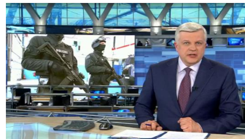
Abb. 19: Wremja, 27.04.2017, 21 Uhr

Kerzen. Jemand betet, legt Blumen nieder und versteckt sein Gesicht. Jemand kann die Tränen nicht aufhalten. Und alle sind erschrocken“ (W, 20.12.2016). „Diese Angst wird uns noch lange verfolgen“ (ebd.), „Es gab sehr viel Blut, das war ungeheuerlich“ (ebd.), sagen die Passanten. Die populärste Zeitung Deutschlands BILD erscheine mit dem Titel „Angst!“ in armlangen Buchstaben. Die Terror- und Angstatmosphäre in Deutschland wird auch an der Bebilderung der Beiträge deutlich: schwer bewaffnete, behelmte Spezialkräfte der Polizei in schwarzer Uniform, mit Schutzwesten ausgestattet (Abb. 18, 19).