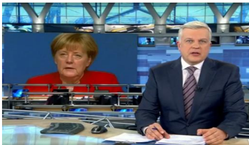
Abb. 20: Wremja, 06.12.2016, 21 Uhr

Die Person der Bundeskanzlerin sowie ihre Politik wurden in zwei Nachrichtenbeiträgen als Hauptthema behandelt: Als Angela Merkel zum neunten Mal als CDU-Chefin wiedergewählt wurde (W, 06.12.2016) und als sie zur gemeinsamen Kanzlerkandidatin der Unionsparteien für die Bundestagswahl erklärt wurde (W, 06.02.2017). Angela Merkel wird als eine Politikerin dargestellt, die von den Parteikollegen und anderen Politikern weitgehend unterstützt wird: Fast 90 Prozent der Delegiertenstimmen bei der Wahl in Essen und elf Minuten Applaus auf dem Parteitag bestätigen die Popularität der Bundeskanzlerin und ihrer Partei (W, 06.12.2017).