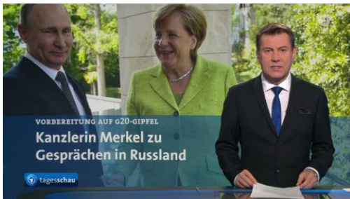
Abb. 6: Tagesschau, 02.05.2017, 20 Uhr

euphorisch werde die US-Armee im polnischen Żagań begrüßt: „Kinder sollen früh lernen: Für Polen sind die USA eine Schutzmacht“ (T, 14.01.2017). Schon hier wird die Konfrontation zwischen Russland und den USA bzw. NATO angedeutet: Die Verlegung der NATO-Truppen wird in Polen als Demonstration der „Stärke gegenüber Russland“ (ebd.) interpretiert, während Russland von einer Bedrohung seiner Sicherheit und gar von einer Provokation spricht. Im Zusammenhang mit Russland tauchen symbolträchtige Begriffe „Besetzung“, „Angst“, „Bedrohung“ und „Aggressor“ auf. Die ungarisch-russischen Beziehungen sind hingegen von einer wirtschaftlichen, strategischen Zusammenarbeit geprägt: Wladimir Putin habe einen Kredit für den Ausbau eines ungarischen Atomkraftwerks in Aussicht gestellt, während der ungarische Ministerpräsident Viktor Orbán sich mittlerweile für die Aufhebung der EU-Sanktionen gegen Russland einsetze (T, 02.02.2017).